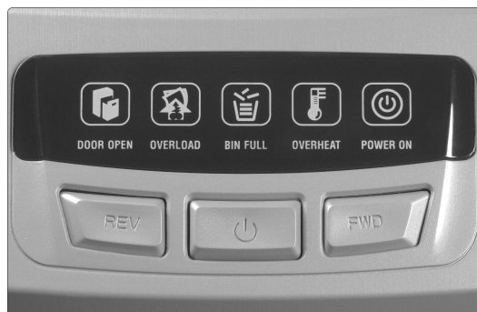
▲ Кнопки переключения режимов